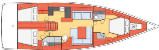
3 cabines + 2 salles d'eau