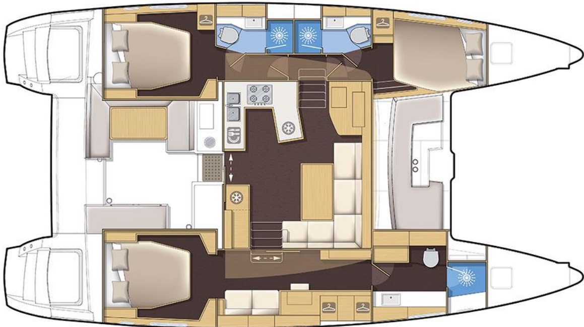
Version 3 cabines / 3 cabin version